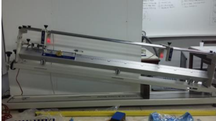
Figura 3 - Montagem do Experimento para o MRUV.