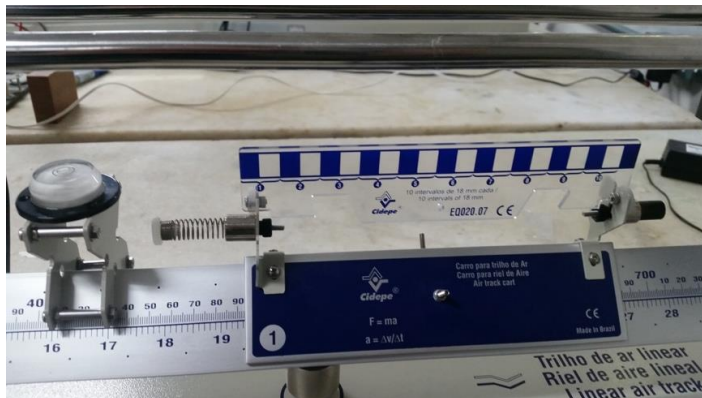
Figura 2 - Montagem para alinhamento do trilho, utilizando carrinho e suporte com nível de bolha.